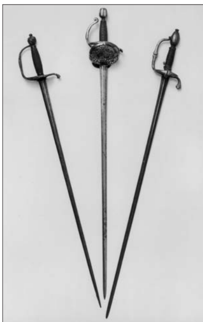
Zbraně ze 17. století: vlevo šlechtický kord, a dva lehčí kordy důstojnické