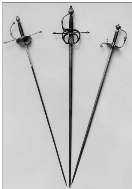
Vlevo soubojový rapír, a dva jezdecké rapíry bodné

Jediný potomek, kterého se nepodařilo dost dobře utajit, byl Don Julio, který měl být plodem lásky s výše jmenovanou Stradovou. Tento levoboček se nevyvedl ve všech směrech. Vedl život tak prostopášný, že to pobuřovalo celou Prahu natolik, že ho na radu císařských rádců nechal jeho otec doslova uklidit na hrad Krumlov. Ten v té době patřil koruně a byl renesanční perlou celého království.