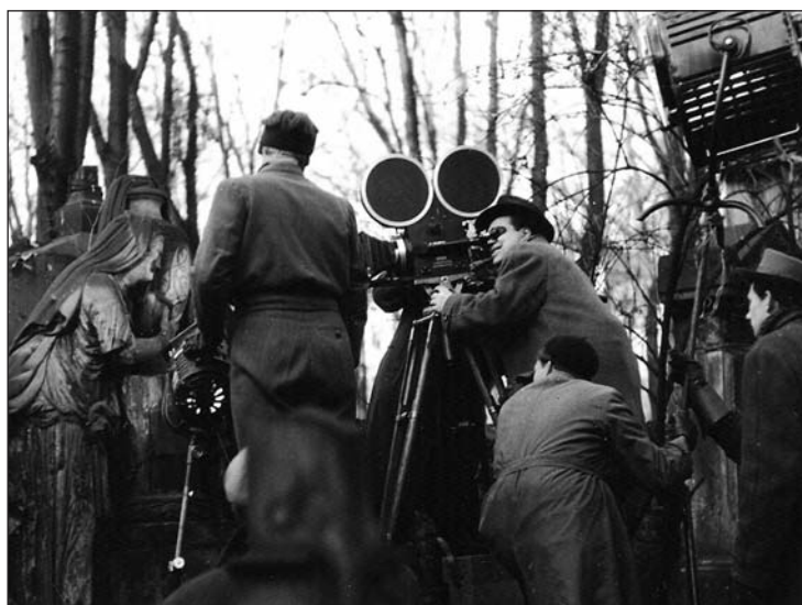
Natáčení filmu o Malostranském hřbitově v letech 1958 až 1959.